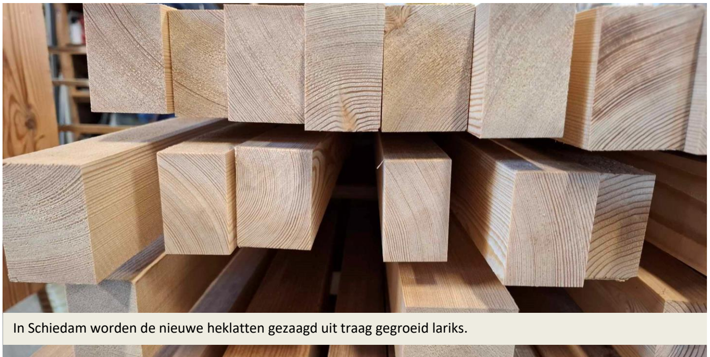
In Schiedam worden de nieuwe heklaten gezaagd uit traag gegroeid lariks.